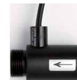
CAPTEUR DE DÉBIT (OPTIONNEL)

Installer toujours le système de dosage à une hauteur sécurisée et pratique qui permettra à la fois à l'utilisateur de charger/décharger la cartouche de 3,6 kg ou de 4,6 kg et qui sera aussi suffisante pour permettre la chute par gravité de la solution de lavage dans le bac du lave-vaisselle.