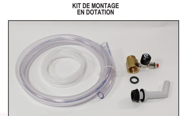
KIT DE MONTAGE EN DOTATION