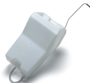
Réservoir 10l réf.606890