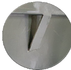
Anses de levage sur la largeur