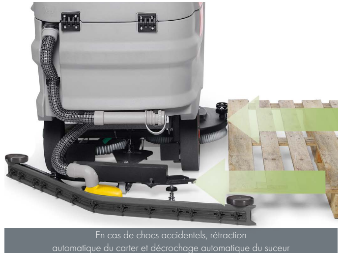
En cas de chocs accidentels, rétraction automatique du carter et décrochage automatique du suceur