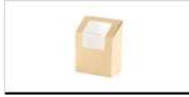
Photo du Produit :

Ref. article : 159911 Désignation : Boîte pour wrap en carton avec fenêtre PLA 550 ml 90x50x130mm Carton/PLA (FSC cert.) Marron Condt carton : 1x1000 Marché : Professional (MS) Gamme : Meal Service Collection : Year-round Produit personnalisé : N (N : No ; Y : Yes)